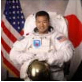
「宇宙飛行士三期生」に選ばれた野口聡一さん」

百八十センチ、八十二キログラムの堂々たる体格。大学時代はアメリカン・フットボール部に所属したスポーツマンだが、意外にも、選抜で重視されたポイントは小学校から続けているボーイスカウトだった。来年度から建設が始まる宇宙ステーションが活躍の舞台となるが、各国の飛行士と助け合っていく協調性がスカウトの活動で養われていると評価されたのだ。